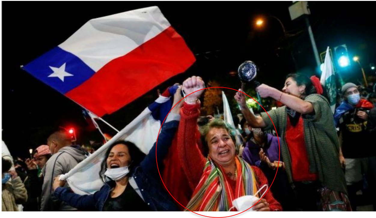
Tabla para discusión en parejas: